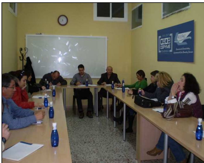
Reuniones del Sector Comercio