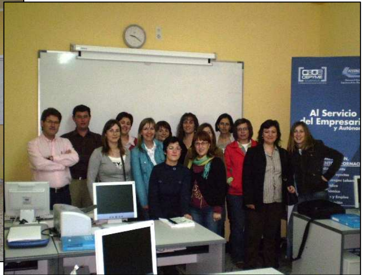
Contabilidad y Análisis de Balances