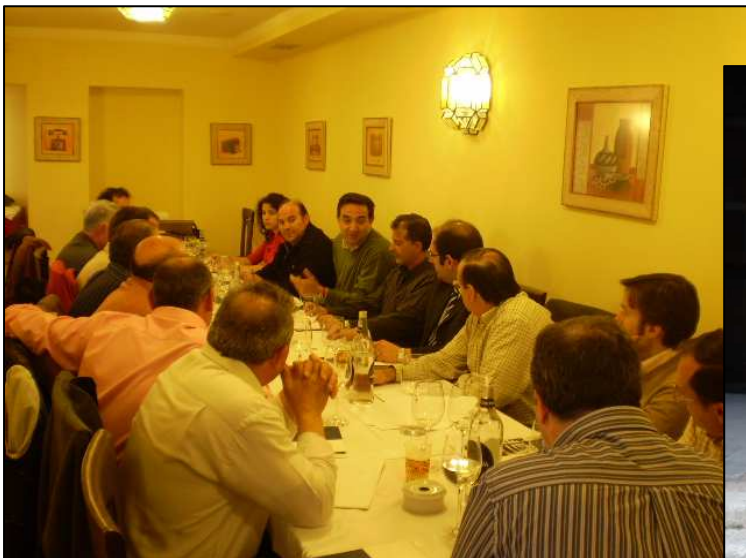
Encuentro empresarial con el Delegado de Industria