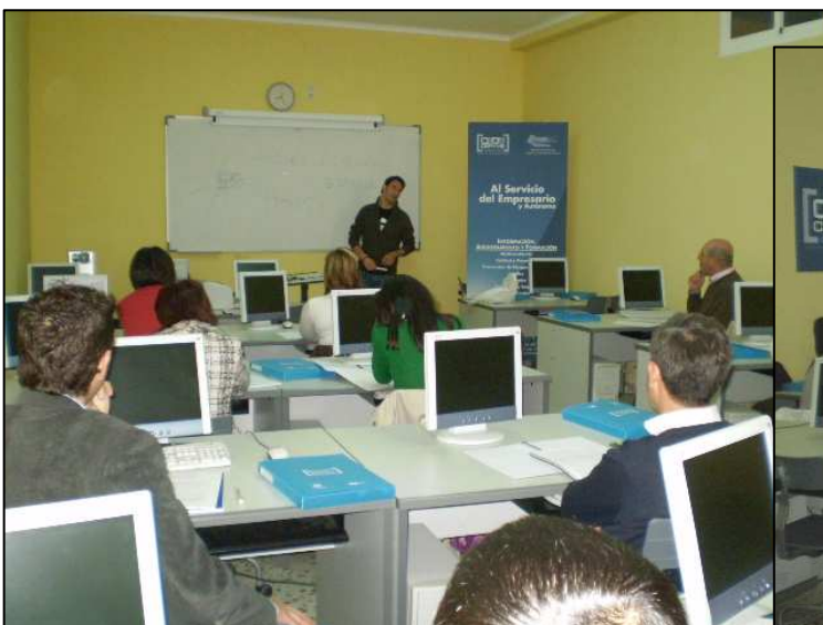
Sistema de Ventas