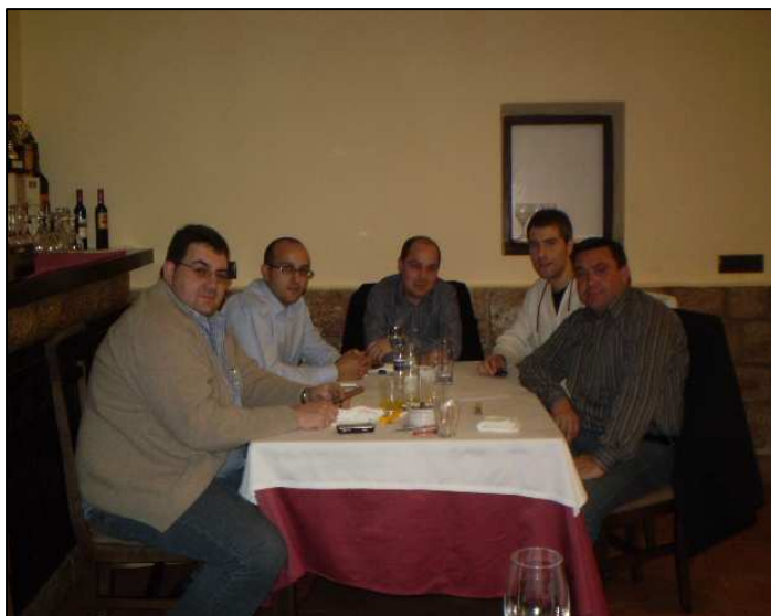
Reunión con la Coop de transporte S. Cristóbal

Nuestro afán, mejorar el desarrollo de nuestra comarca: