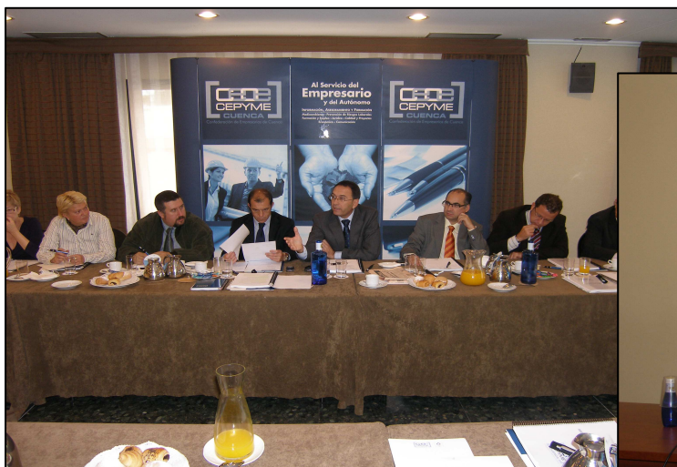
Desayunos con las Asociaciones que forman CEOE