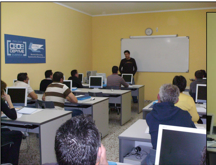
Transporte Nacional por Carretera