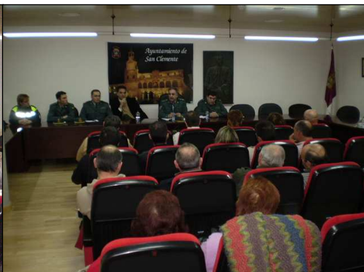
Reunión con el Teniente Coronel de Cuenca