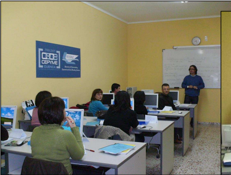
Gestión Práctica Laboral

Fomentamos la formación de trabajadores y desempleados: