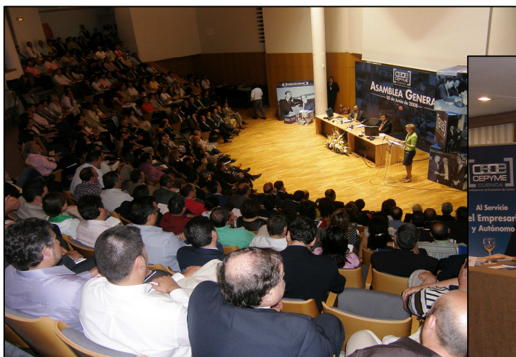
Asamblea General CEOE CEPYME CUENCA