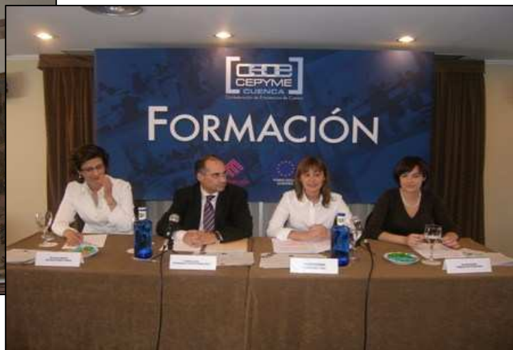
Clausura curso PRL por la Consejera de Trabajo y Empleo