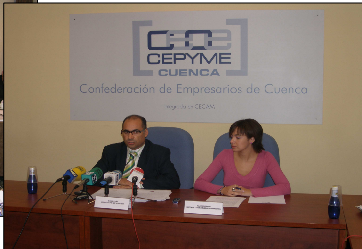
Presentación cursos 2008-2009