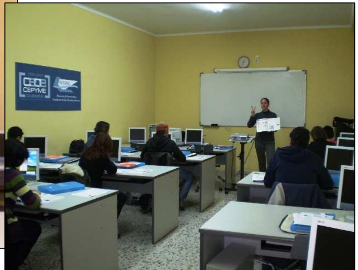
Inglés atención al público