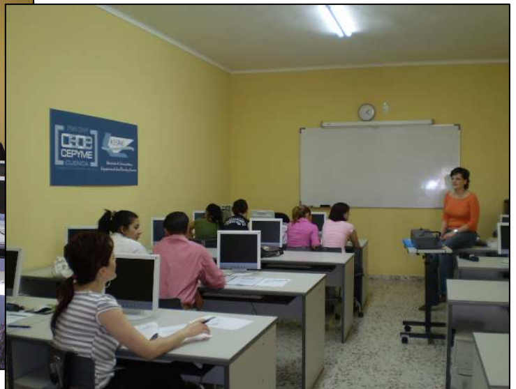
Manipulador de Alimentos