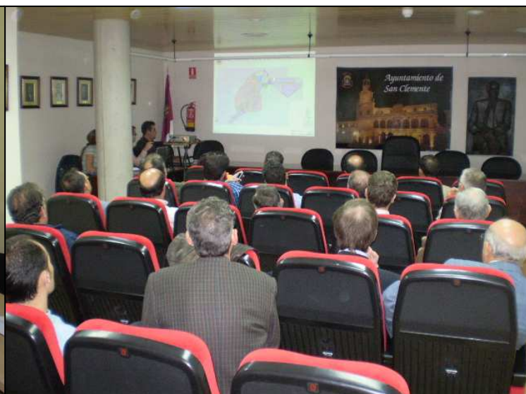
Presentación Borrador Plan Ordenación Municipal