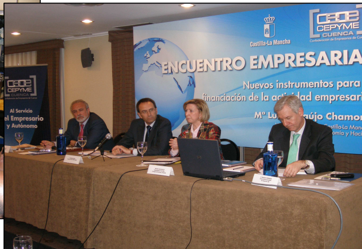
Encuentro Empresarial Nuevos Instrumentos de Financiación