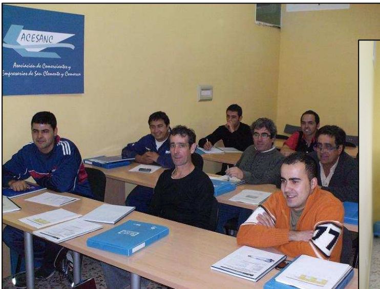
Electricidad y electrónica del automóvil