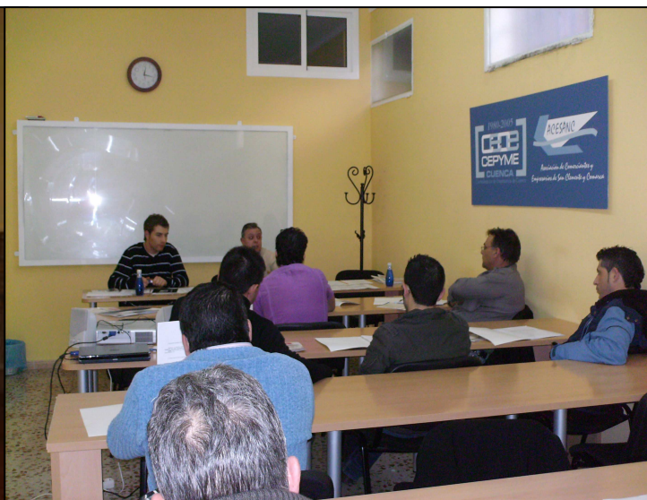
Reunión con los hosteleros