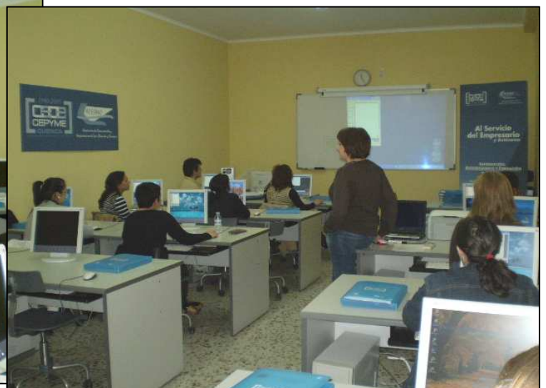
Aplicaciones informáticas de Gestión