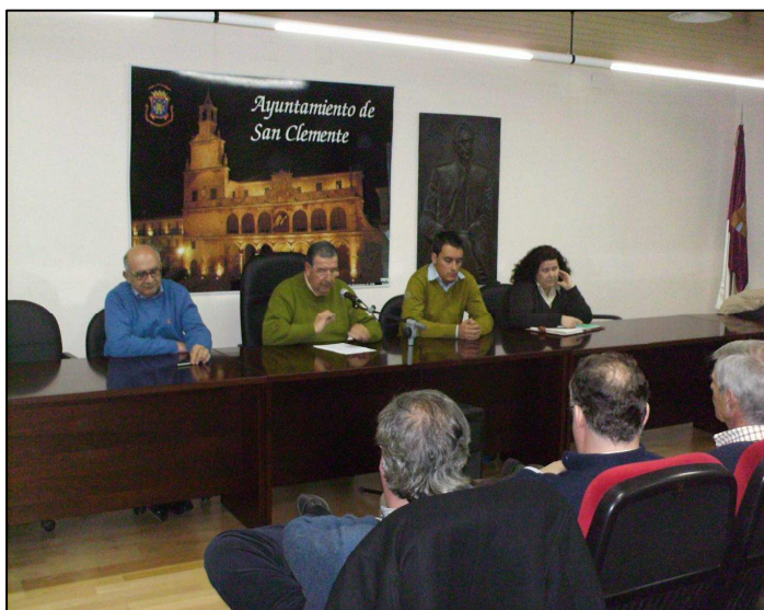
Comienzo del Plan de Ordenación Municipal